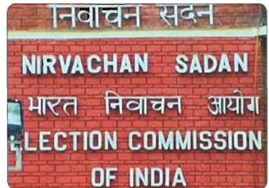
இந்திய தலைமைத் தேர்தல் அலுவலகம்

மக்களின் பிரதிநிதிகளை, நாடாளுமன்றத்திற்கும், மாநில சட்டசபைகளுக்கும் தேர்ந்தெடுக்கும் செயலை நடத்தி முடிக்க, ஒரு தேர்தல் ஆணையம் இந்திய அரசியல் அமைப்புச் சட்டப்படி அமைக்கப்பட்டுள்ளது. இது ஒரு சுதந்திரமான அமைப்பாகும். இவ்வாணையம் புதுடில்லியைத் தலைமையிடமாகக் கொண்டு செயலாற்றி வருகிறது. இவ்வாணையத்தை 'நிர்வாச்சன் சதன்' என்றும் அழைப்பர். இந்திய தேர்தல் ஆணையம் மூன்று நபர்களைக் கொண்டது. ஒரு தலைமைத் தேர்தல் ஆணையர் மற்றும் அவருக்கு இணையான இரண்டு உறுப்பினர்கள் தேர்தல் ஆணையர்களாக நியமிக்கப்பட்டுள்ளனர். இம் மூவரும் குடியரசுத் தலைவரால் நியமிக்கப்படுவர். இவர்களது பதவிக்காலம் ஆறு ஆண்டுகளாகும். இதில் தலைமைத் தேர்தல் ஆணையர், உச்ச நீதிமன்ற நீதிபதிகளுக்கு இணையான அதிகாரம் பெற்றவராவார்.