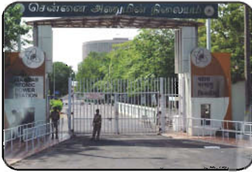
அனுமின் நிலையம் கல்பாக்கம்

அதிகரித்து வரும் மின்சார தேவைகளை நிறைவு செய்ய அனுமின்சக்தி திட்டங்களே தீர்வு என்பதை 1954 ஆண்டிற்கு முன்னரே அரசு அறிந்து கொண்டது. எனவே அனுசக்தி தொழில் நுட்பங்களை மின் உற்பத்தி, வேளாண்மை, மருத்துவம் மற்றும் தொழிற்துறை ஆகிய அமைதிப்பணிகளுக்கு பயன்படுத்துவதையே முக்கிய கொள்கையாகக் கொண்டிருந்தது. தற்பொழுது இந்தியாவில் 17 அனுமின் நிலையங்கள் செயல்பட்டு வருகின்றன.