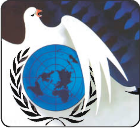
உலக அமைதி சின்னம்

இந்தியா ஆகஸ்ட் 15, 1947 ஆம் ஆண்டு விடுதலை பெறும் வரை ஒரு சார்பு நாடாக விளங்கியது. எனவே உலக விவகாரங்களில் எத்தகைய முக்கியப் பங்கும் வகிக்கவில்லை. விடுதலைக்குப்பிறகு, உலக விவகாரங்களில் தீவிரமாகவும், தன்னிச்சையாகவும் ஈடுபட்டு வருகிறது. இதன் மூலம் மிகக் குறுகிய காலத்தில் உலக அரங்கில் தனக்கென ஒரு தனி இடத்தைப் பெற்றுத் திகழ்கிறது. இந்தியா அமைதியை அடிப்படையாகக் கொண்ட நாடு. எனவே உலகில் அமைதியை நிலைநாட்ட தொடர்ந்து பாடுபட்டு வருகிறது. சர்வதேச அரங்கில் அமைதி, பாதுகாப்பு மற்றும் ஒத்துழைப்பை மேம்படுத்த பல்வேறு நடவடிக்கைகளை மேற்கொண்டு வருகிறது.