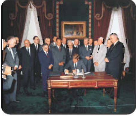
அணு சோதனை தடை ஒப்பந்தம்

மற்றும் ஹைட்ரஜன் குண்டுகள் போன்றவற்றை உருவாக்கி வருகின்றன. இதனைத் தடுக்கவில்லையென்றால், உலகம் அழிக்கப்பட்டுவிடும். எனவே இந்தியா அணுஆயுத உற்பத்தியை கடுமையாக எதிர்த்ததோடு மட்டுமன்றி, அணுஆயுத உற்பத்திக்கு எதிராகவும் குரலெழுப்பி வருகிறது.