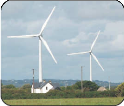
காற்றாலை மின் உற்பத்தி

மரபுசாரா மின் உற்பத்தியில் காற்று மின் சக்தி தமிழ்நாட்டில் முக்கிய இடத்தைப் பெற்றுள்ளது. தமிழ்நாட்டில் கோயம்புத்தூர், கன்னியாகுமரி, தூத்துக்குடி, திருநெல்வேலி மற்றும் இராமநாதபுரம் மாவட்டங்களில் காற்றாலைகள் உள்ளன.