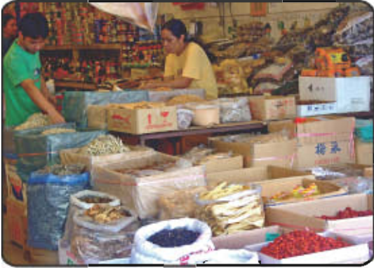
பல சரக்கு கடை

சிக்கனமான முறையில் வியாபாரத்தை விரிவாக்கும் நோக்கில் பல விதமான பொருட்கள் நமக்கு சந்தைகளில் மலிவான விலையில் கிடைக்கின்றன. நமக்கு பொது நிறுவனங்களாகிய காப்பீடு, போக்குவரத்து, மின்சாரம், நிதி மற்றும் வங்கியின் மூலம் சேவைகள் கிடைக்கின்றன. நமது தேவைகள் மற்றும் சேவைகள் விளம்பரங்களின் மூலமாக நிறைவு செய்யப்படுகிறது.