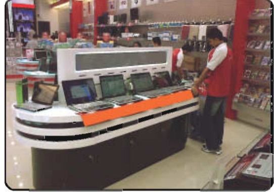
மின் கருவி கடை

முடியவில்லை. எனவே நுகர்வோர் சில நேரங்களில் ஏமாற்றப்பட்டு, வியாபாரிகளால் துன்புறுத்தப்படுகிறார்கள்.