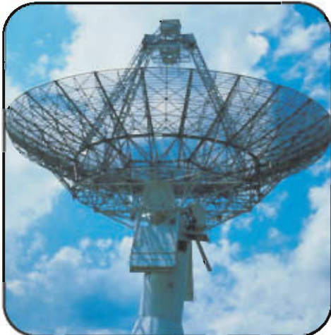
தகவல் தொழில்நுட்ப கோபுரம்

கணிணி பயன்பாட்டின் மூலம் தகவல் மேலாண்மைக்கு கணிணிகளையும் மென்பொருட்களையும் பயன்படுத்துவதையே தகவல் தொழில்நுட்பம் என்கிறோம். இந்தியாவில் பெங்களூர், ஹைதராபாத் மற்றும் சென்னை முக்கிய