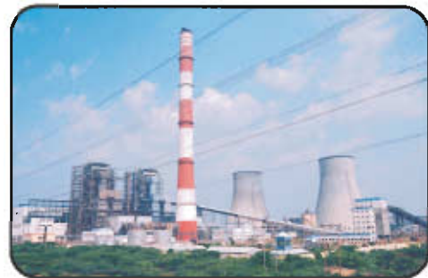
அனல் மின் நிலையம்-நெய்வேலி