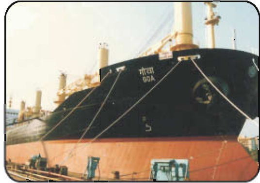
இந்துஸ்தான் கப்பல் கட்டும் தளம்-விசாகப்பட்டினம்

தொழிற்முன்னேற்றத்திற்காக பொதுத் துறையின் கீழ் பல தொழிற்நிறுவனங்களை தொடங்கப் பட்டன. இந்துஸ்தான் கப்பல் கட்டும் தளம், சிந்திரி உரத்தொழிற்சாலை, ரயில் பெட்டி இணைப்புத் தொழிற்சாலை மற்றும் காகித ஆலைகள் முக்கிய பொதுத்துறை தொழிற்நிறுவனங்களாகும். மேலும் கனரக தொழிற்சாலைகள், இயந்திர கட்டுமானத் தொழில்கள், இரும்பு வார்ப்பு தொழிற்சாலைகள், பெட்ரோலியம் மற்றும் வேதியியல் உரத் தொழில்களுக்கு முன்னுரிமை வழங்கப்பட்டது.