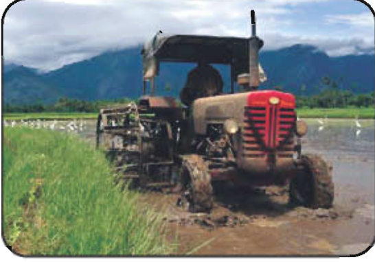
பசுமை புரட்சியின் விளைவு