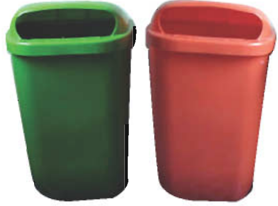
சுற்றுச் சூழல் விழிப்புணர்வு

3. நுகர்வோர் ஒரு ராஜாவைப் போல் இருந்தாலும் அவர்கள் அநேக நாடுகளில் பலவழிகளில் ஏமாற்றப்படுகிறார்கள்.